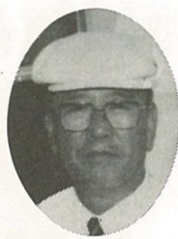
熊谷市グラウンドゴルフ協会