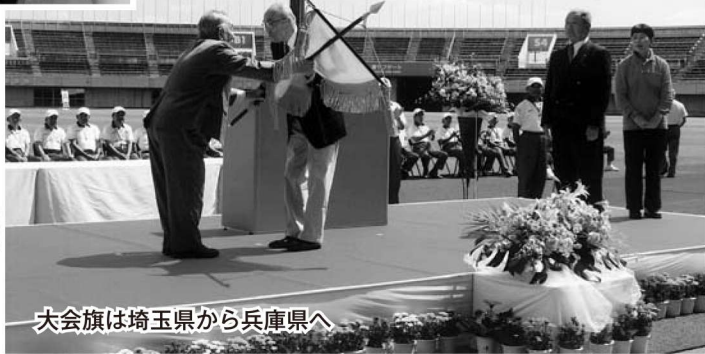
大会旗は埼玉県から兵庫県へ