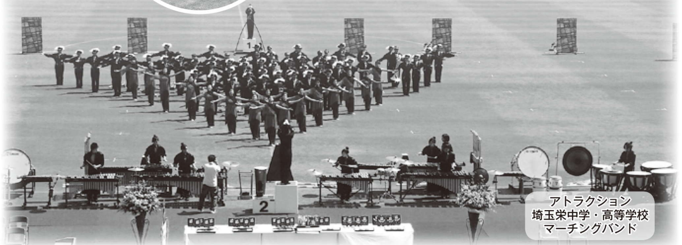
アトラクション 埼玉栄中学・高等学校 マーチングバンド