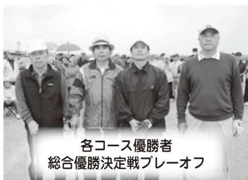
各コース優勝者 総合優勝決定戦プレーオフ

松・竹・梅・桜コースに分かれ、午前8時30分スタート。前半は残念、後半は日頃の練習を思い出しプレイした結果梅コースで優勝。さらに、4名でプレーオフ、大観衆の中で総合優勝を果たすことが出来ました。この喜びと感動を胸に、グラウンド・ゴルフを愛し続けていきたいと思えます。