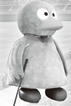
埼玉県のマスコット ヨバトン