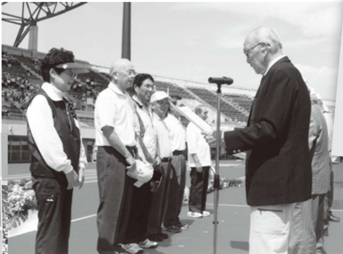
団体戦優勝の埼玉県チーム